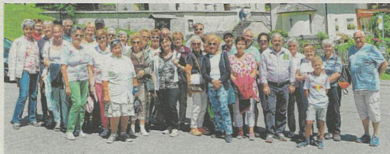
Der Oberndorfer Pensionistenverband ging auf Reisen nach Osttirol.